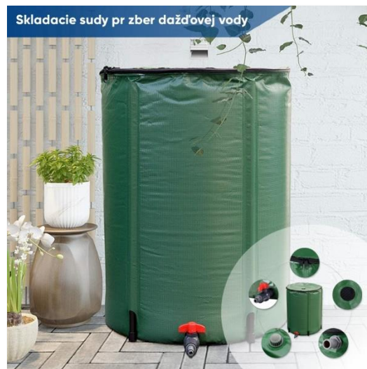
Skladacie sudy pr zber dažďovej vody

Do sortimentu sme zaradili skladacie sudy na zber dažďovej vody. Sud je možné zložiť ľahko do 5 minút. V ponuke nájdete prevedenie s objemom 200 l (typ: 8220) alebo 500 l (typ: 8221) . Menšie prevedenie je vybavené kohútikom s možnosťou pripojenia záhradnej hadice a väčšie prevedenie je potom vybavené dvoma kohútikmi, jedným na pripojenie hadice a druhým na stáčanie vody. Sudy sú v hornej časti vybavené otvorom na plnenie so sieťou chrániacou pred vniknutím nečistôt. Sú tiež vybavené vnútornými filtrami, otvorom proti preplneniu a vďaka hornému otvoru nie je vyžadované sud pripájať k odkvapovému zvodu.